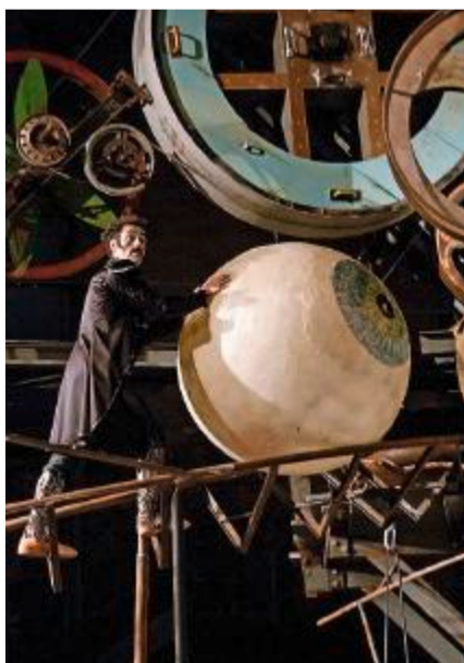
Herumklettern im Gesicht des einäugigen Riesen.

Im Zentrum des Stücks steht ein Werk des Künstlers Jean Tinguely. Zusammen mit seiner Ehefrau Niki de Saint Phalle und befreundeten Künstlern hat der Basler Plastiker einst in einem Wald bei Paris die Skulptur «Le Cyclope» gebaut. Ein Modell der 22 Meter hohen Figur steht im Basler Tinguely-Museum. Tinguely und seine Freunde haben die Riesenplastik so gebaut, dass die Besucher im Gesicht des einäugigen Riesen herumklettern und auf Entdeckungstour gehen können. Die Artisten im Winterthurer