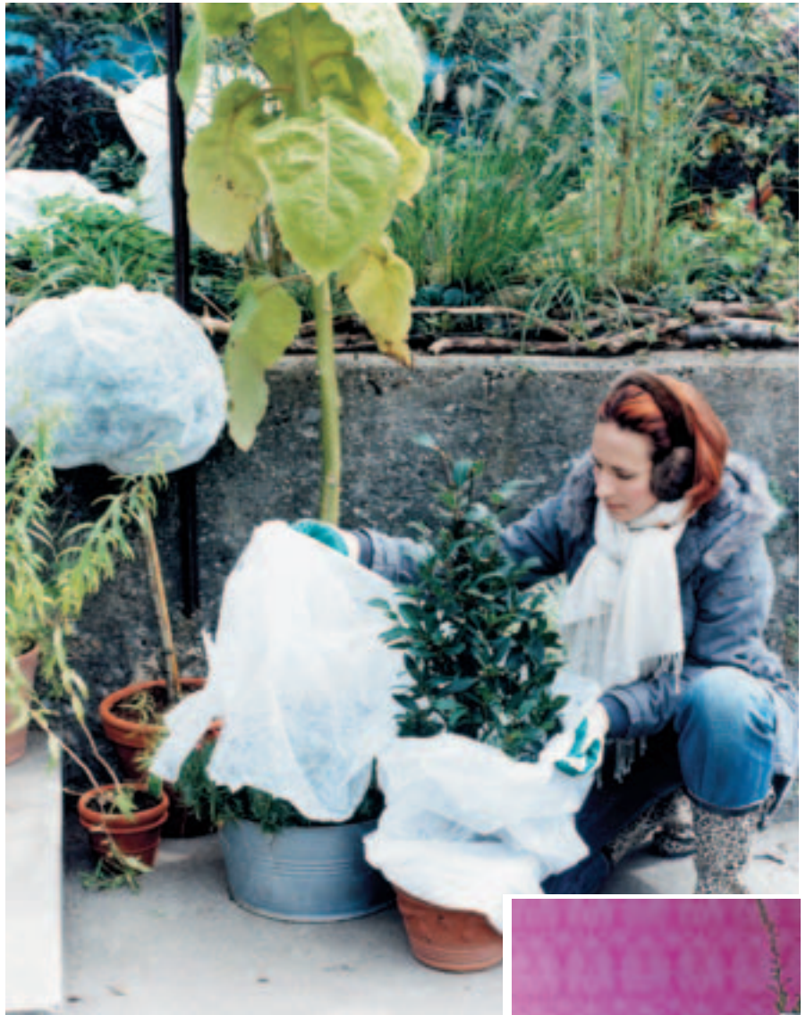
Winterfest: Mützen aus Vlies für die Topfpflanzen

Vor allem aber sind die immergrünen Kübelpflanzen auf die Wintersonne empfindlich. Sind sie erst einmal gefroren, tut es ihnen nicht gut, plötzlich wieder an der Sonne zu stehen. In sehr kalten Zeiten decke ich sie also mit einem Vlies ab. Das kann man einfach wieder entfernen, sobald das Wetter milder wird. Die Wurzelballen hingegen werden in Vlies eingewickelt, die